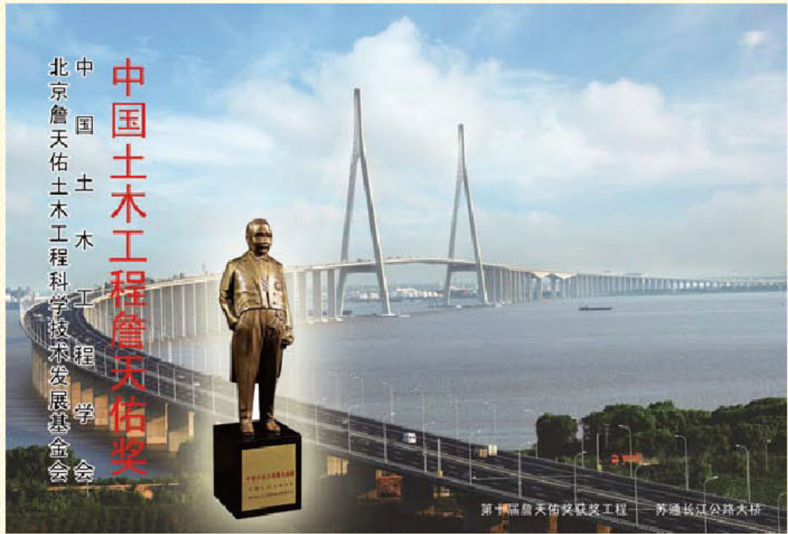
第十届中国詹天佑奖获奖工程 苏通长江公路大桥