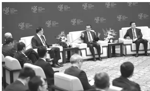
培养“企业家精神”，让每个人都有成功的机会

中国电子科技集团公司总经理樊友山在发言中建议，打通信息壁垒、加强信息通信网络基础设施建设，鼓励大众创业、万众创新，加快推动大数据产业的发展。李克强当即要求参会的有关部门负责人认真加以研究。