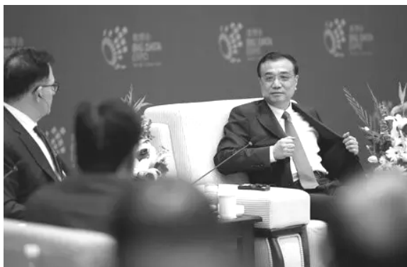
传统产业的改造升级，很大程度还需要依靠 新经济、新动能

“过去人们曾经认为，互联网就是‘虚拟’世界。但现在由于大数据、云计算、‘互联网+’等新技术的产生，虚拟世界和真实世界正在日益融合。我们进入了一个新的时代。”总理说。