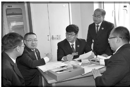
办案检察官讨论案情

2016年2月14日，春节后上班的第一天，新疆维吾尔自治区伊犁哈萨克自治州塔城地区最大的媒体《塔城日报》刊发了一则重要新闻。该报道称，2月6日，塔城地区中级法院宣判：被告人周辉犯贪污罪，判处有期徒刑十三年，并处罚金人民币150万元，犯挪用公款罪，判处有期徒刑十二年，决定执行有期徒刑十九年，并处罚金人民币150万元；扣押单位已扣押的人民币743万元及利息1.2万元上缴国库，继续追缴未退赔赃款200万元；大众牌轿车一辆依法没收；收缴的赃款140万元，依法返还裕民县吉也克镇政府。